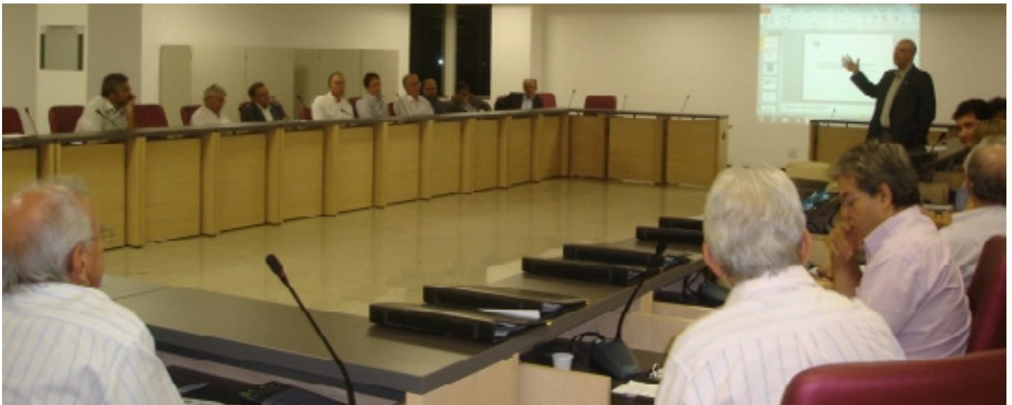
Ahpaceg apresenta Classificação Hospitalar a diretores e conselheiros do Cremego