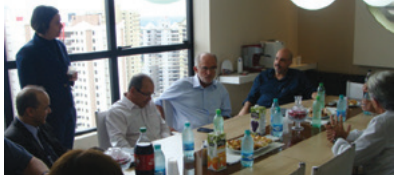
Representantes da Ahpaceg e hospitais associados reunidos com o secretário da Saúde Antônio Faleiros