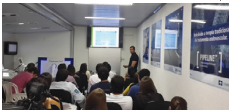
Grupo de profissionais goianos, em uma palestra