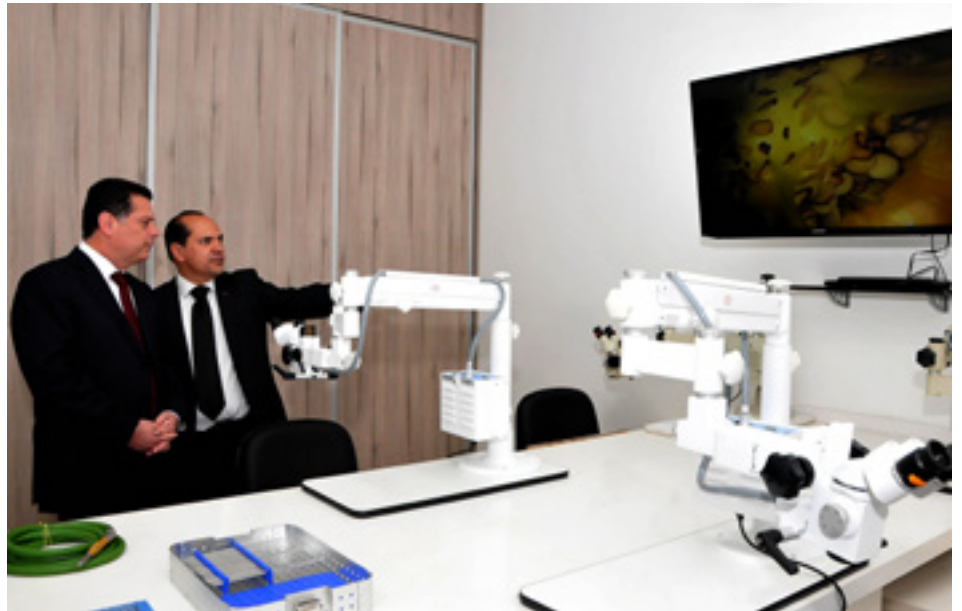
Governador de Goiás Marconi Perillo prestigia a inauguração