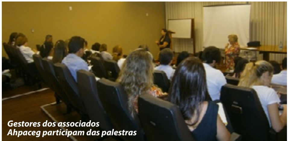
Gestores dos associados Ahpavec participam das palestras

De acordo com as palestrantes, os temas focaram o esclarecimento de questões relacionadas às legislações e resoluções vigentes de qualidade da segurança do paciente, gestão hospitalar, higienização hospitalar, lavanderia, centro cirúrgico, CME e assistências médica e de enfermagem.